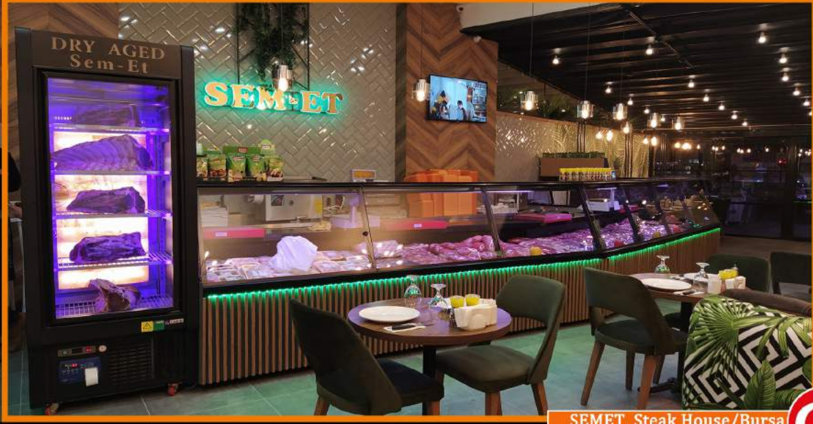
SEMET Steak House/Bursa

Marso Satış ve Pazarlama Müdürlüğü'nün Hazırladığı 21. Yıl Özel Bültenidir.