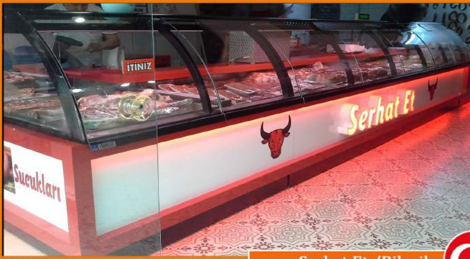
Serhat Et / Bilecik

Kurulduğu 30 Ağustos 1999 tarihinden beri;ülkemizde 5 binden fazla işyerine projeler üreten MARSO,özellikle Almanya merkezli Avrupa ülkelerinde de iddialı projelere imza attı.