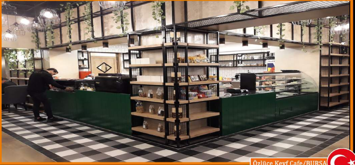
Özlüce Keyf Cafe/BURSA