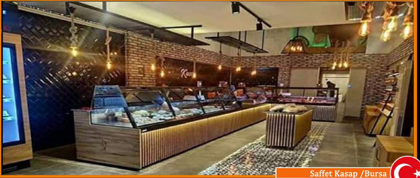
Saffet Kasap / Bursa